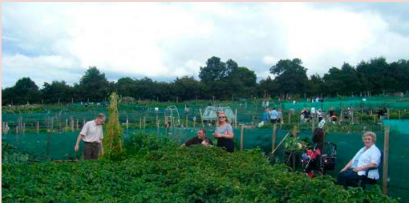
Одна из сторон нового гражданского общества: участки в окрестностях Дублина.

Мэри П. Коркоран, Национальный университет Ирландии Мэйнут, Ирландия