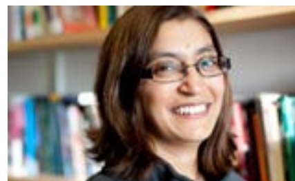
Гурминдер Бхамбра , ведущий социолог из Англии, критикует традиционные подходы к глобальной социологии и предлагает собственную концепцию «взаимосвязанных социологий».