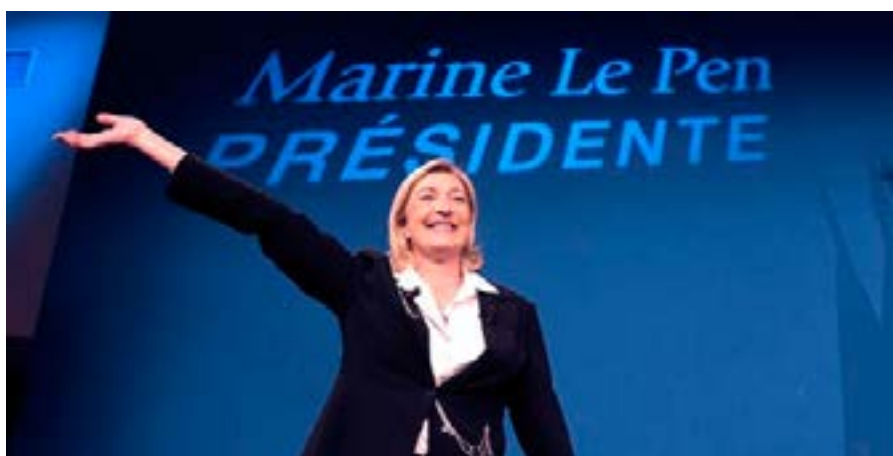
Марин Ле Пен, кандидат в президенты.