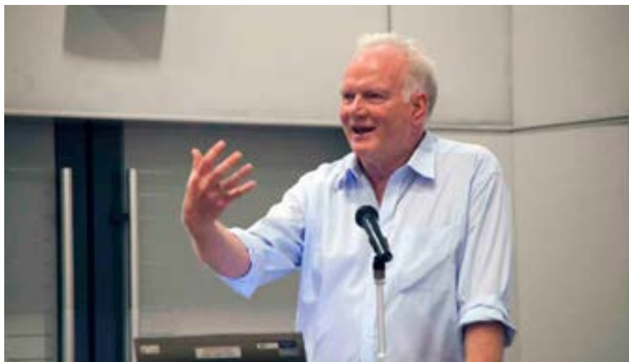
Ульрих Бек на Всемирном социологическом конгрессе МСА в Йокогаме в 2014 году.