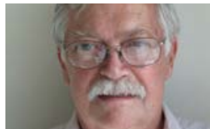
Иван Селеньи , выдающийся венгерский социолог, размышляет о своем богатом и разнообразном опыте в американской социологии и предсказывает ее упадок.