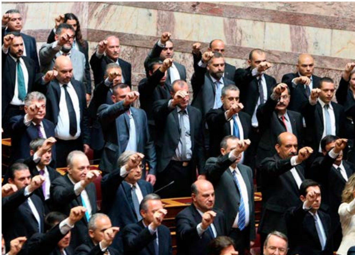
Неонацистское движение «Золотой рассвет» в греческом парламенте.

Весна 2013 года стала поворотным моментом, когда поистине наступила «весна разгневанных народов», как сказал бы Хобсбаум. Создается впечатление, что европейская политика начала ускоряться: выборы, следующие друг за другом приносили неожиданные и неприятные результаты. Крайние правые и левые партии начали пробиваться вперед. Хотя Франсуа Олланд и выиграл президентские выборы во Франции, Марин Ле Пен пришла третьей. Крайне левые и крайне правые вместе собрали больше голосов избирателей, чем действующий на тот момент президент Саркози или его оппонент-социалист.