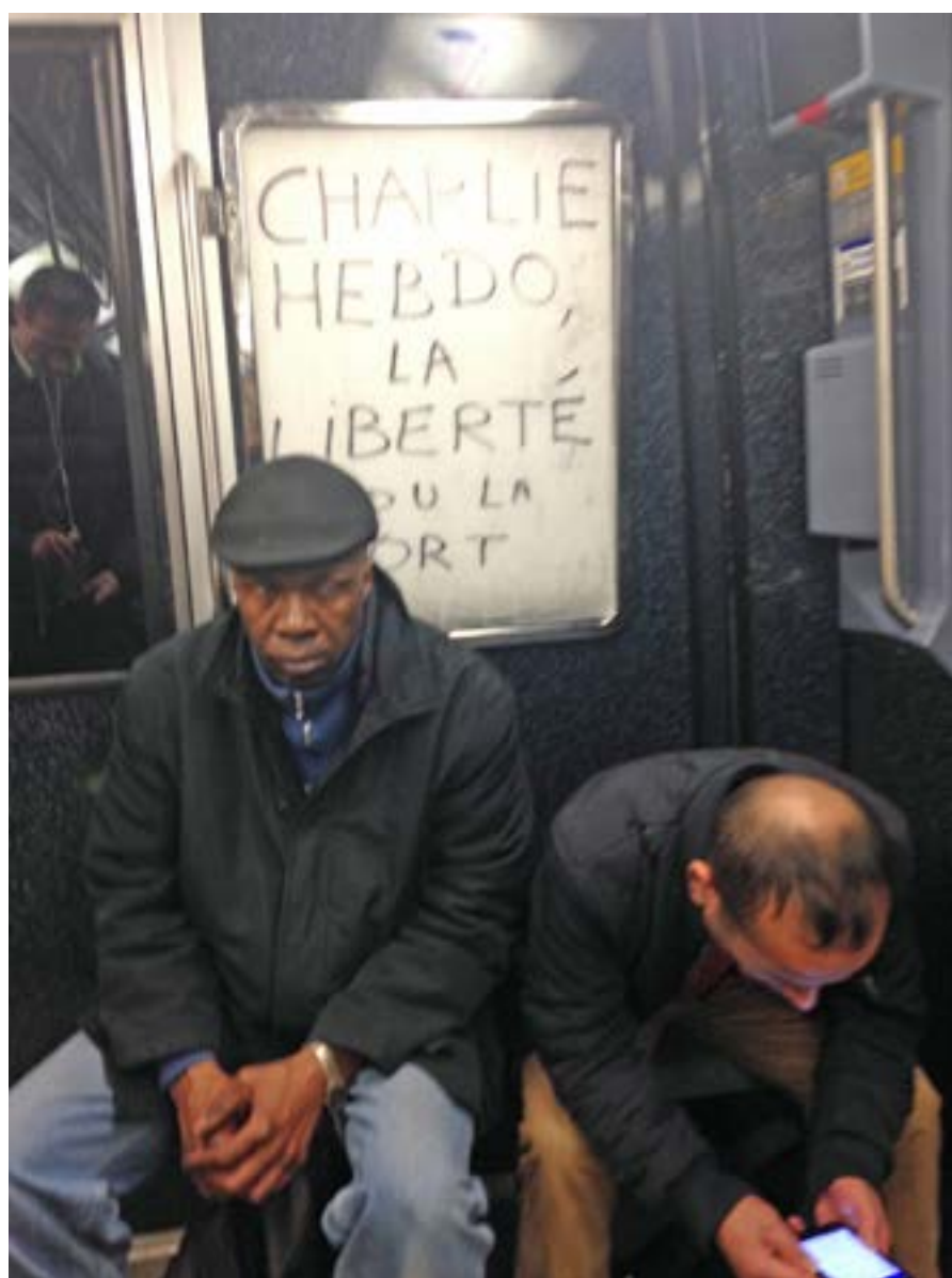
Парижское метро. 12 января 2015.

Стефан Бо, Высшая школа социальных наук (EHESS), Париж, Франция